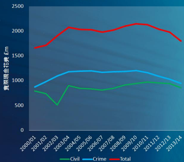
法律扶助實際花費2000/01 - 2013/14