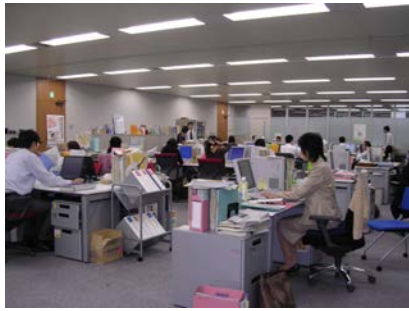
司法支援中心本部內同仁工作之剪影，看起來