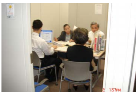
（審查室內審查委員（律師）

該中心為方便民眾可以就近請教法律專家諮詢，因此推出「免費法律諮詢」業務，民眾不僅到地方事務所（分會），甚至到與該中心簽約之 8,523 位律師或 3,463 位司法書士事務所 31 去，只要初步審查該案件有符合前開甲或丙任一要件時，都得免費向民眾來提供法律諮詢的服務。（費用由該中心支出）諮詢方式以 30 分鐘為原則。諮詢完如有必要，諮詢律師得協助撰寫簡單之法律文書（稱為簡易援助），或轉介民眾至地方事務所提出申請，值得一提的是，該律師得於諮詢當時承諾接辦該案，只需民眾至分會申請時特別指名即可。