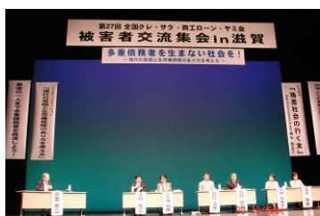
(會議討論時的剪影)

2007年9月28日於日本滋賀縣大津市，所召開的全國卡債、消金、工商貸款、地下錢莊受害者交流集會，是自昭和56年以來創辦以來第27回，此次也由全國卡債、消金問題對策協議會（以下簡稱為對協）及全國各地卡債、消金、工商貸款、地下錢莊受害者會（以下簡稱為被協）所共同主辦，以「 朝向一個沒有多重債務者的社會—以現代貧窮與生存權保障之觀點 」為本次大會的基調，集結了來自全國1,500位受害者，有志法律家（主要是律師及司法書士），以及各機關的對策諮詢師、志工等。