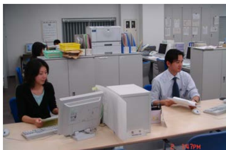
（東京分會入口處接待櫃臺的兩位年輕同

1. 扶助（援助開始決定）2. 不扶助（援助開始決定）。如決定扶助，可選擇訴訟代理、撰狀或裁判前和解程序的代理任一種。如不扶助，則應附理由通知申請人。