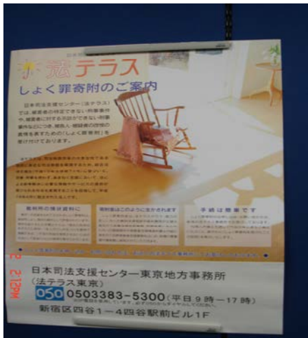
司法支援中心新發售之贖罪券，可作為法院對被告量刑時之參考，類似中世紀時歐洲的天主教會所發行的贖罪券。