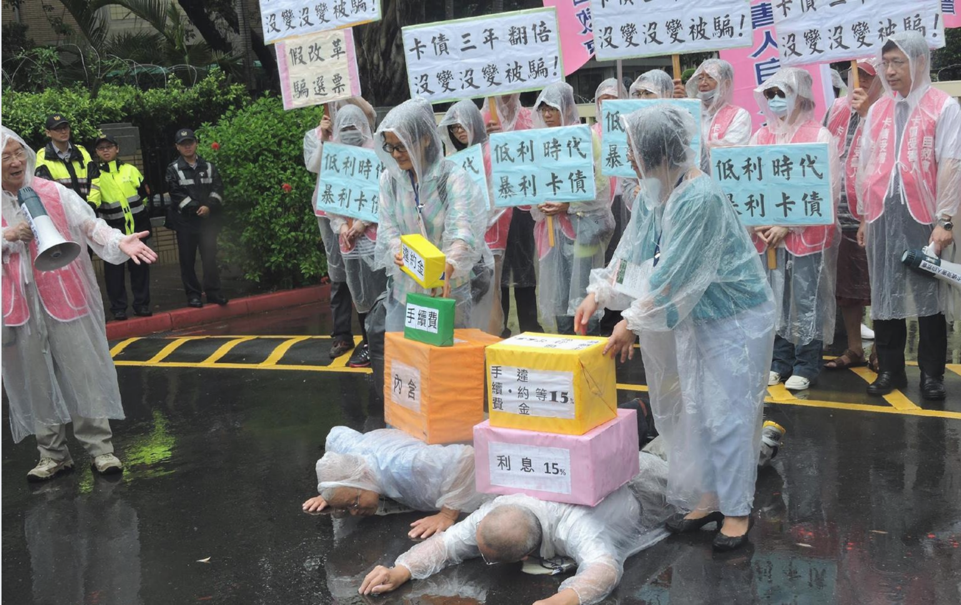
2015.08.31 행정원 앞에서 금리인하 청원