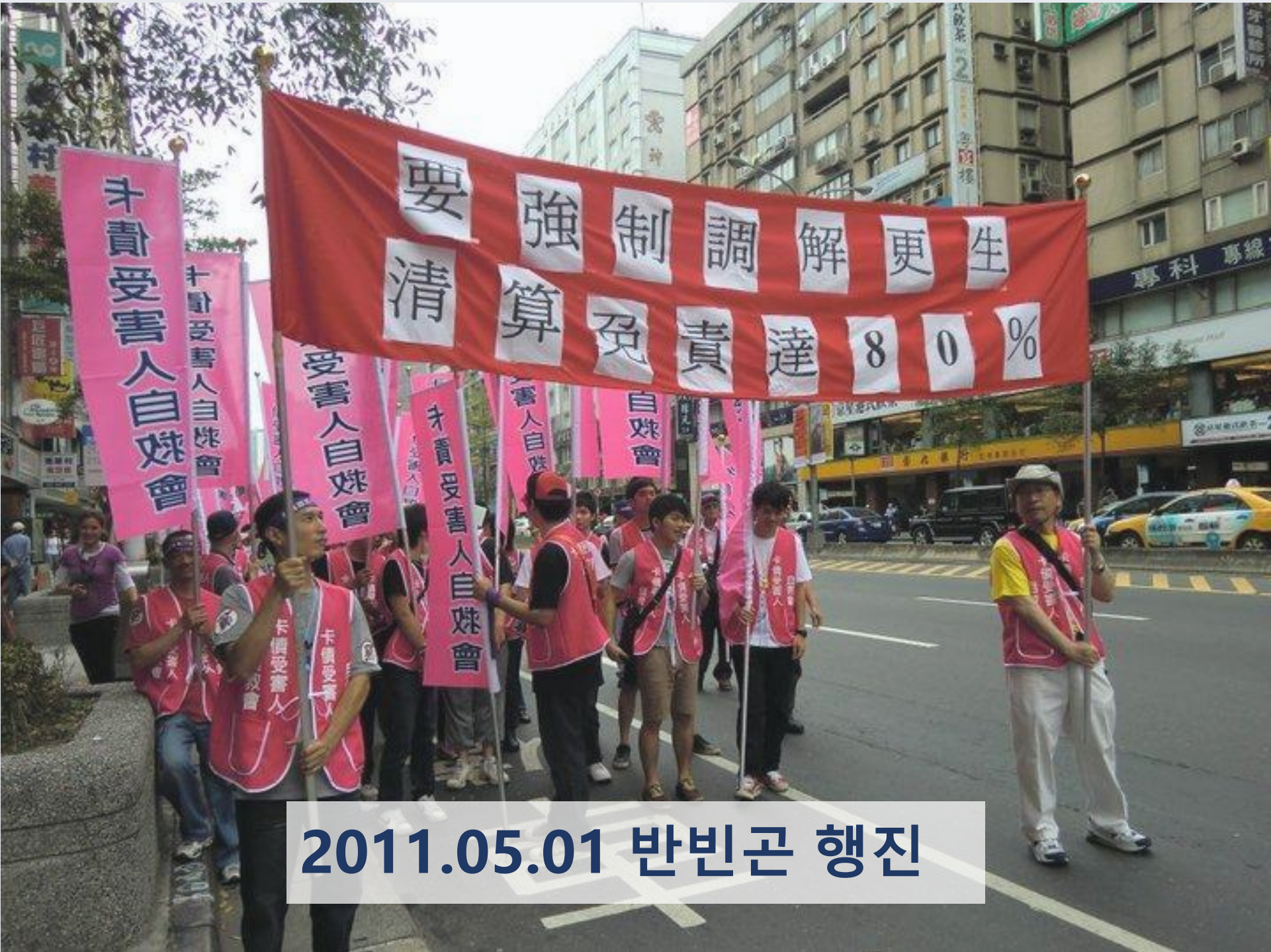
2011.05.01 반빈곤 행진